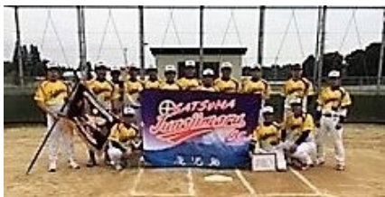
優勝・薩摩十の字丸SC