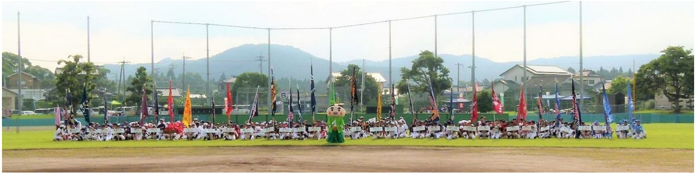
開会式先導者・南九州市キャラクター お茶むらい くん