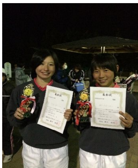
表彰式 (中学生女子優勝)