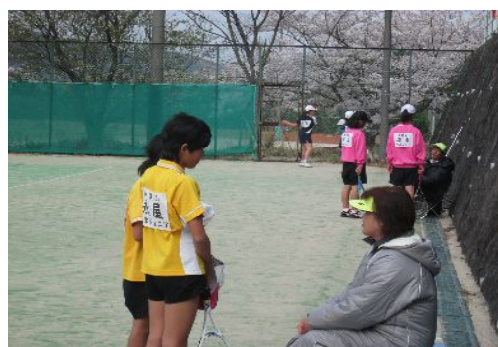
試合風景 (コーチのアドバイス)