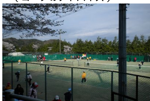
試合風景 (満開の桜の下で・・・)