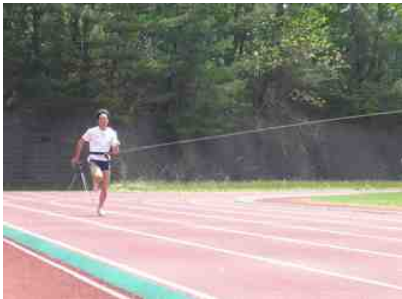
図 19.5: トーイング走

効果については個人差があると思われるが、著者である私の場合は高校時代にトーイング走を走練習に取り入れており、効果を実感できるトレーニングであった。