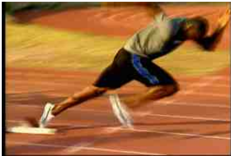
図 19.2: スタート動作 [131]

とびだした後は前に出された体を支えるように足を接地する。このとき自分の力を出しやすい歩幅を把握しておくこと、その後の加速動作がスムーズに行なえる。