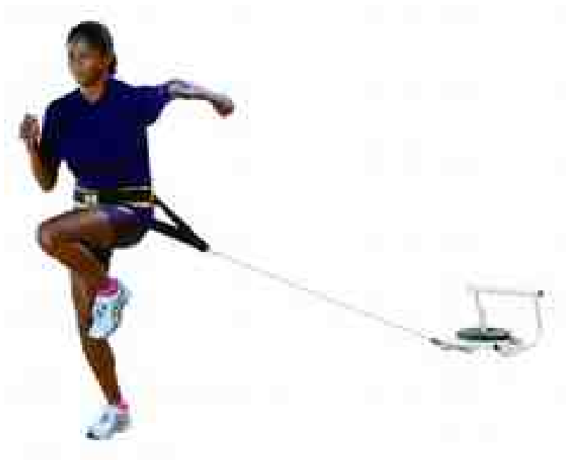
図 19.6: ソリを使った負荷走

著者である私の場合は冬季練習で，パワー養成トレーニングとしてソリやタイヤを引く負荷走を走練習の種目として採用することが多かった．