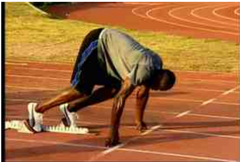
図 19.1: スタート姿勢 [131]

他にもショートスタートやロングスタートといった特殊なスタートポジションの取り方があるが、高跳び選手は気にする必要はない。